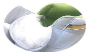
フワフワのポリエステル材が寒さから守ります