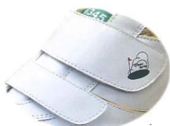
ダブルマジック式で脱ぎ履きラクラク